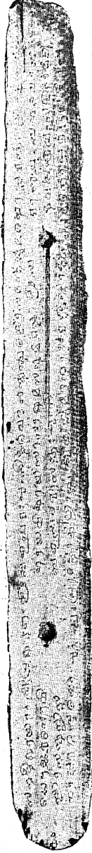
Liṅgānuśāsana Manuscript from Travancore. In Early Malayāḷam Script.